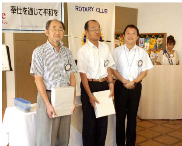
9月会員誕生の皆様 オメデトウ(^▽^)ゴザイマース